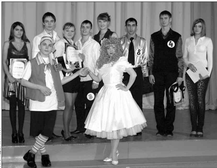
▲ В финале конкурса – снимок на память